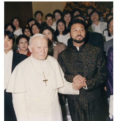
1990年 ローマ法王 John Paul IIの前で日本人として初謁見コンサート